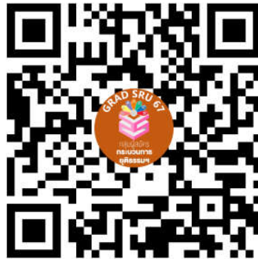
หลักสูตรศิลปศาสตรมหาบัณฑิต สาขาวิชาการพัฒนาระบบการยุติธรรม