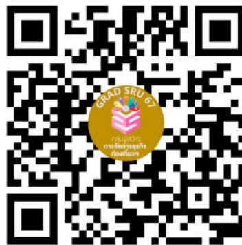
หลักสูตรศิลปศาสตรมหาบัณฑิต สาขาวิชาการจัดการธุรกิจท่องเที่ยวและบริการ