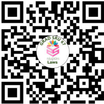
หลักสูตรนิติศาสตรมหาบัณฑิต