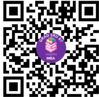
หลักสูตรบริหารธุรกิจมหาบัณฑิต