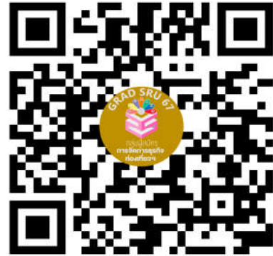
หลักสูตรศิลปศาสตรมหาบัณฑิต สาขาวิชาการจัดการธุรกิจท่องเที่ยวและบริการ