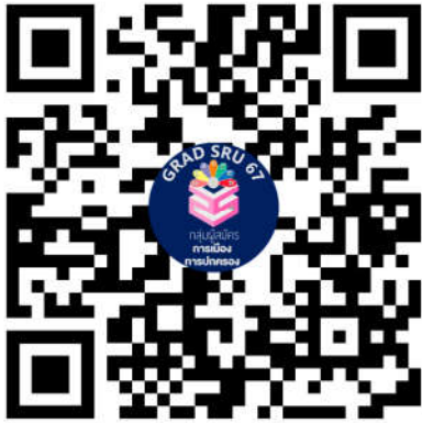
หลักสูตรรัฐศาสตรมหาบัณฑิต สาขาวิชาการเมืองการปกครอง