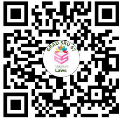
หลักสูตรนิติศาสตรมหาบัณฑิต