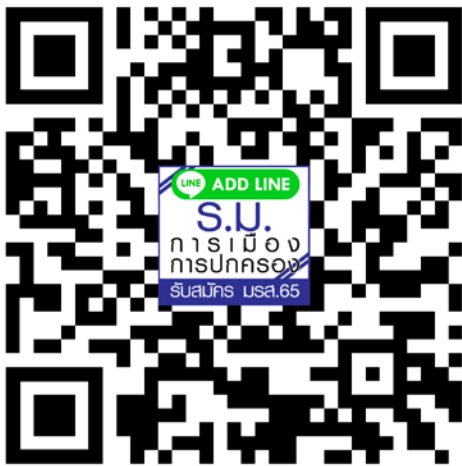
หลักสูตรรัฐศาสตรมหาบัณฑิต สาขาวิชาการเมืองการปกครอง