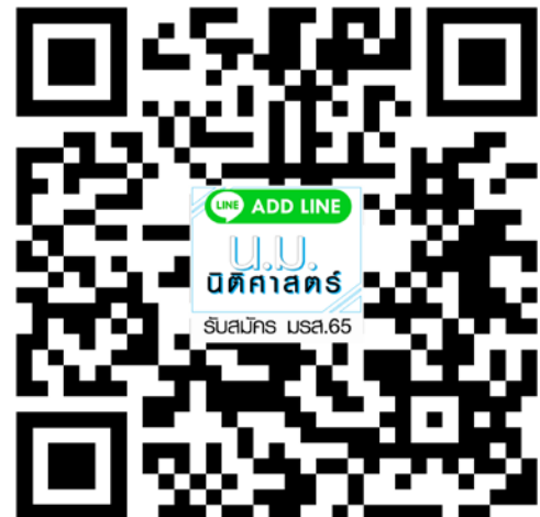
หลักสูตรนิติศาสตรมหาบัณฑิต สาขาวิชานิติศาสตร์