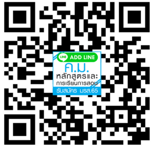
หลักสูตรครุศาสตรมหาบัณฑิต สาขาวิชาหลักสูตรและการเรียนการสอน