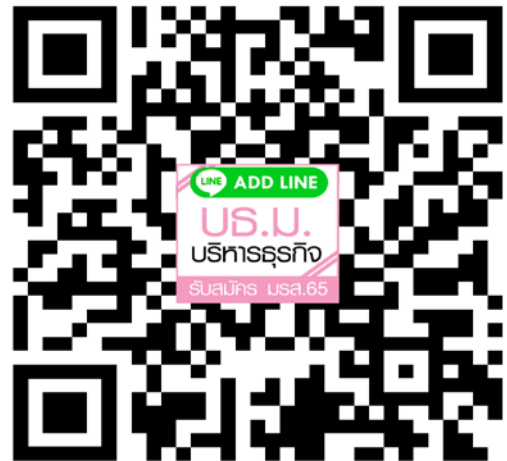
หลักสูตรบริหารธุรกิจมหาบัณฑิต