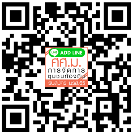
หลักสูตรศิลปศาสตรมหาบัณฑิต สาขาวิชาการจัดการชุมชนท้องถิ่น