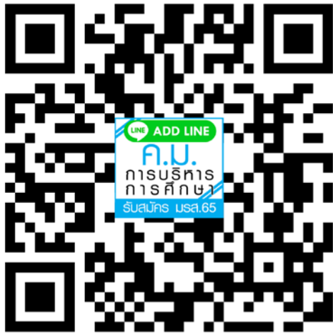
หลักสูตรครุศาสตรมหาบัณฑิต สาขาวิชาการบริหารการศึกษา

หมายเหตุ ขอให้ผู้สมัครทุกคนแอดไลน์กลุ่มเพื่อรับข้อมูลข่าวสารการสมัครและสอบคัดเลือกอีก ๑ ช่องทาง